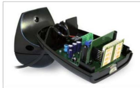
APRO 20K mono/bidireccional banda K

Detector a microondas para el control de puertas industriales